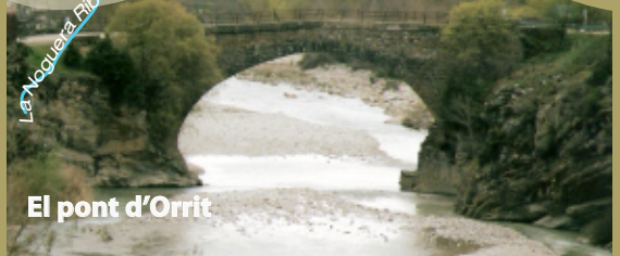
El pont d'Orrit