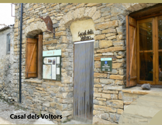
Casal dels Voltors