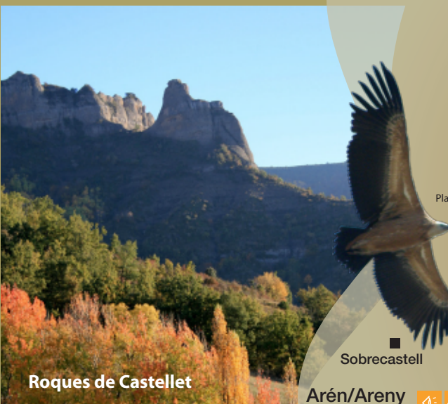
Roques de Castellet