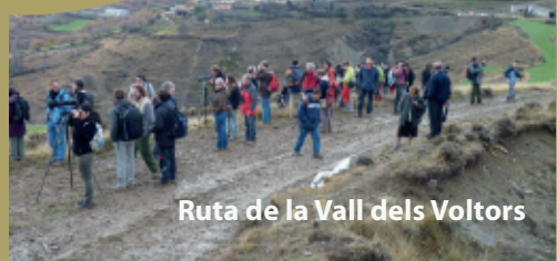
Ruta de la Vall dels Voltors