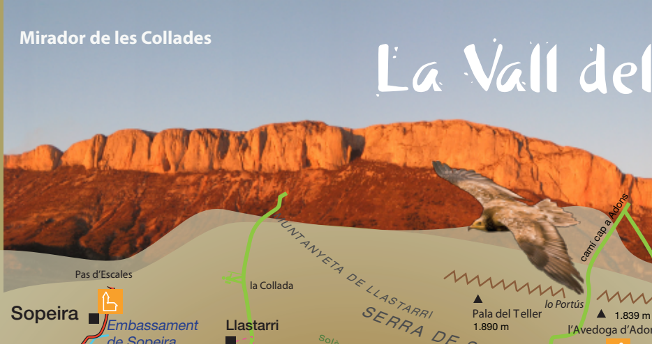
Mirador de les Collades