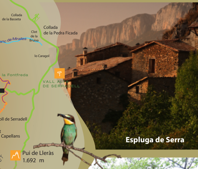
Espluga de Serra