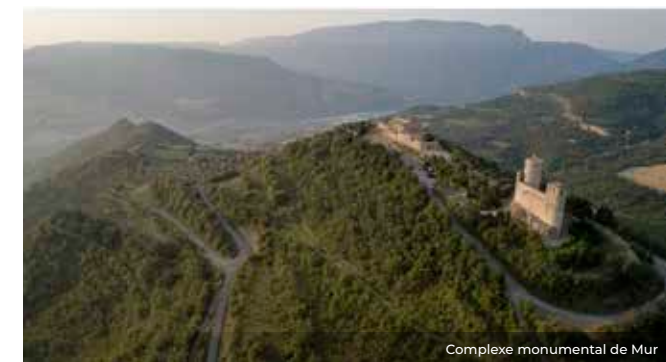
Complexe monumental de Mur

Pour vous faire vivre intensément cette période et profiter au maximum de vos déplacements, chaque proposition s'inscrit dans une zone géographique déterminée.