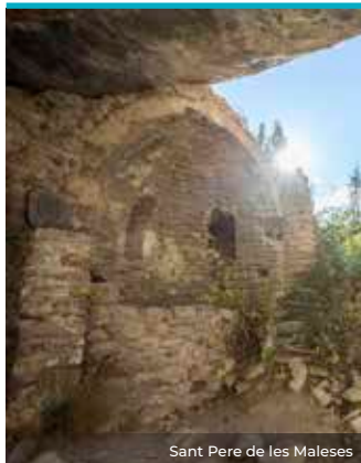
Sant Pere de les Maleies