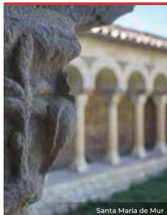
Santa Maria de Mur