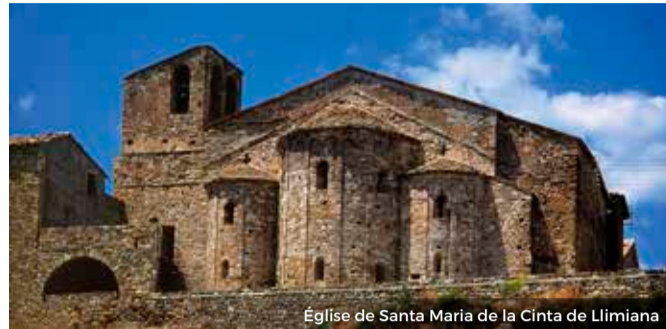
Église de Santa Maria de la Cinta de Llimiana

Le centre de Llimiana se dresse sur une falaise rocheuse qui domine l'accès au bassin de Tremp. Cette position de surveillance, renforcée par les remparts qui encerclaient le bourg, en a fait au fil de l'histoire un endroit pratiquement inexpugnable. Il ne reste rien du château, mais l'entrelacs de ses ruelles révèle le caractère fortifié du bourg.