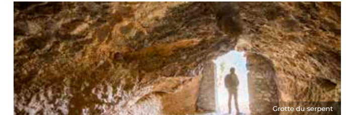
Grotte du serpent

La Grotte du serpent, située sur le sentier pédestre qui grimpe jusqu'au ravin de Sant Pere, était habitée par un serpent qui dévorait les hommes et les animaux passant devant. Un moine, fatigué de perdre les ânes qui portaient la nourriture au monastère, prépara un piège mortel : il chargea un âne avec des pains remplis de couteaux. Depuis lors, la carcasse de l'animal est visible sur le plafond de la grotte (légende recueillie par Pep Coll).