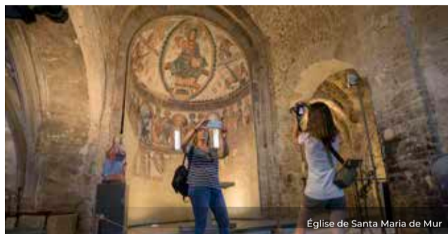
Église de Santa Maria de Mur

L'ensemble de Mur est considéré comme un des monuments les plus importants du patrimoine roman de notre pays. Son château, paradigme de l'architecture militaire de l'époque, fut la résidence des comtes Ramon V et Valença, qui fondèrent la maison canoniale de Santa Maria de Mur en 1069. L'abside principale de l'église abrita les magnifiques peintures murales qui se trouvent aujourd'hui au Museum of Fine Arts de Boston.