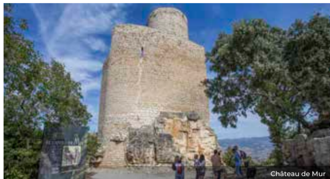
Château de Mur

Le Montsec s'érigea en frontière naturelle et politique suite à la présence musulmane et, plus tard, à la formation du comté de Pallars Jussà. Au cours de ces siècles agités, les limites territoriales furent défendues grâce à un puissant réseau de fortifications encore visibles au nord de la chaîne de montagnes. Vers le XI siècle, les tours d'Estorm, Alsamora, Ginebrell, l'Arbull et les bourgs fortifiés de Moror, Castellnou et Fabregada seront décisifs dans la configuration des structures sociales et administratives.