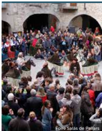
Foire Salàs de Pallars