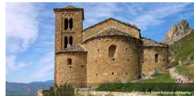
Église de Sant Esteve d'Abella

Un des plus charmants recoins du Pallars Jussà. Adossé à une falaise rocheuse, le village se trouve dans un site spectaculaire, véritable paradis des escaladeurs et des amateurs de nature. C'est dans ce cadre unique que nous trouvons l'église de Sant Esteve, qui conserve les lignes pures de l'architecture romane. Vous pourrez observer à l'intérieur le retable gothique de la Pietat, datant de la fin du XV siècle.