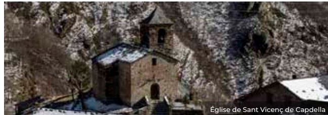
Église de Sant Vicenç de Capdella

Sant Vicenç de Capdella et Sant Martí de la Torre de Capdella peuvent être considérés comme deux joyaux de l'art roman de la vallée. L'église de Sant Vicenç offre un style roman de haute qualité. Elle abritait la sculpture monumentale en bois d'un Christ crucifié, aujourd'hui exposée au MNAC.