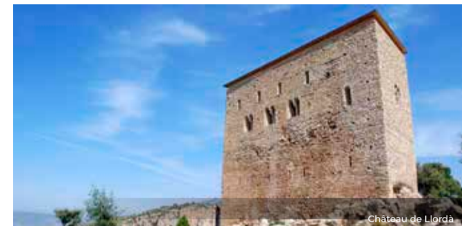
Château de Llordà

Santa Maria de Covet, datée du XII siècle, abrite un des meilleurs ensembles sculpturaux de l'art catalan et constitue, sans nul doute, un ouvrage unique au sein de l'art roman du Pallars. Son portail, présidé par la représentation du Christ en Majesté, combine la thématique religieuse avec des personnages quotidiens, grotesques et d'influence païenne. Le programme sculptural s'étend sur le chevet de l'édifice et à l'intérieur de celui-ci.