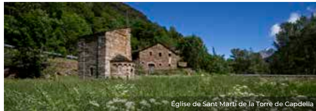
Église de Sant Martí de la Torre de Capdella

Au beau milieu de la vallée, nous trouvons Sant Martí de la Torre de Capdella, documentée depuis le X siècle. Elle conserve une petite absidiole, de grande beauté stylistique, adossée aux vestiges de ce qui était sans doute un clocher. En visitant les villages de la vallée, vous découvrirez d'autres petits trésors comme Santa Llúcia de Paüls ou Sant Cristau d'Oveix.