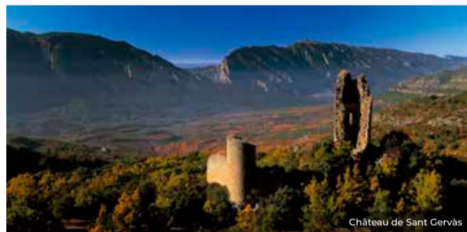
Château de Sant Gervàs

Le château de Sant Gervàs contrôle stratégiquement l'accès au territoire depuis Vilanova de Meià. Construit à partir du X siècle, c'est le seul château à conserver le village fortifié qui s'étendait aux pieds de l'enceinte supérieure. Il resta actif jusqu'à la fin du XIV siècle, époque où il fut pris d'assaut par le comte de Foix. À 200 mètres du château, vous trouverez la chapelle de Sant Gervàs, datée du XII siècle.