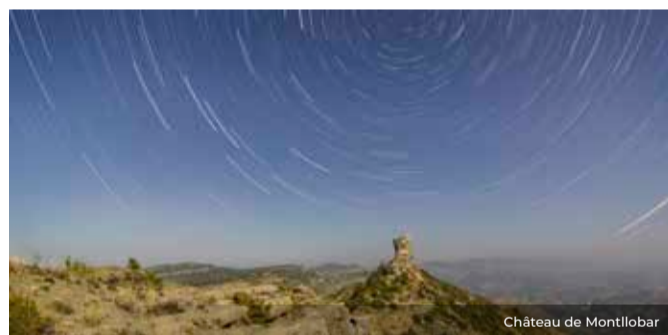
Château de Montllobar

Dominant le passage entre les bassins de la Noguera Pallaresa et de la Noguera Ribagorçana, se dressent les vestiges du château de Montllobar. Le toponyme, auquel est attribué une origine romane, fait référence à l'abondance de loups qui habitaient les forêts de la contrée : « mōnte l pāre », montagne des loups.