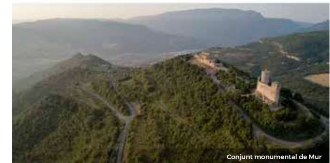
Conjunt monumental de Mur

Per tal que us endinseu intensament en aquest període i aprofiteu al màxim els vostres desplaçaments, cada proposta s'emmarca en una àrea geogràfica determinada.