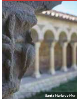
Santa Maria de Mur