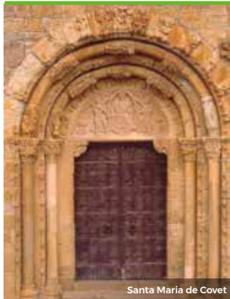
Santa Maria de Covet