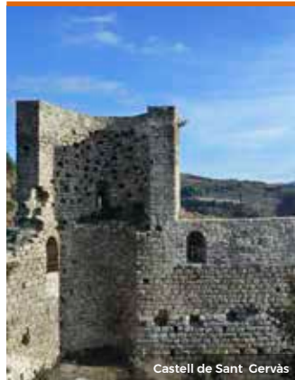
Castell de Sant Gervàs