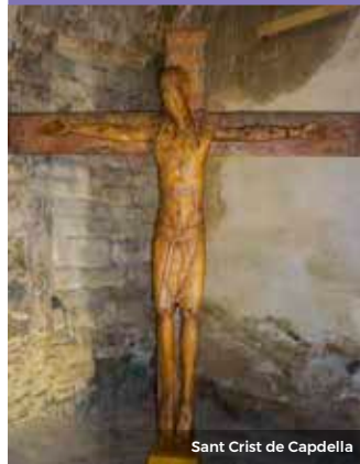
Sant Crist de Capdella