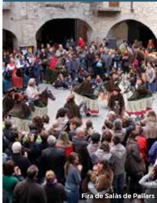
Fira de Salàs de Pallars