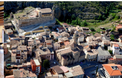
5 Castell d'Os de Balaguer i Museu de Campanes de Catalunya Tel. 973 438 232 / 639 772 265 · OS DE BALAGUER www.castelllosdebalaguer.lleidaitu.com