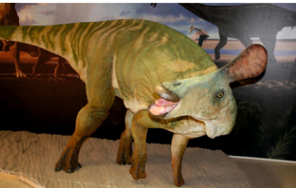
2 Museu de la Conca Dellà Tel. 973 665 062 · ISONA I CONCA DEL·LÀ www.parc-cretaci.com