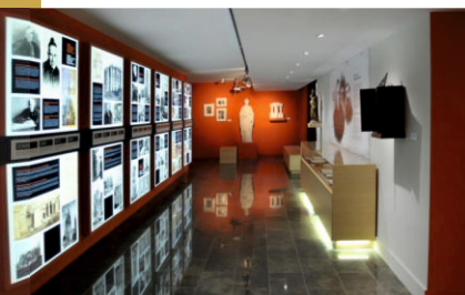
7 Casal Manyanet Tel. 973 654 818 · TREMP www.manyanet.org