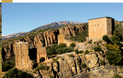
13 Castell de Llordà Tel. 973 665 062 · ISONA I CONCA DEL·LÀ www.isona.cat