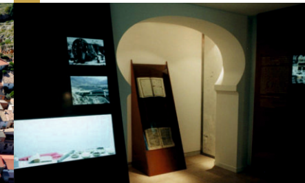
6 Museu de la Noguera Tel. 973 445 194 · BALAGUER www.museucn.com