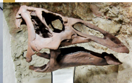
17 Centre d'Interpretació de Tartareu Tel. 973 454 004 · TARTAREU www.lesavellanes.com