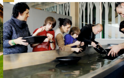
9 Centre d'Interpretació de l'Or del Segre Tel. 973 448 668 · BALAGUER www.museucn.com