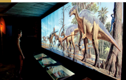
15 Museo de los Dinosaurios Tel. 974 540 200 / 680 200 424 · ARÉN (Huesca) www.dinosauriosdearen.es