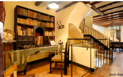
3 Seró. Espai Transmissor Tel. 661 224 195 / 973 445 194 · SERÓ www.seroespaitransmissor.cat