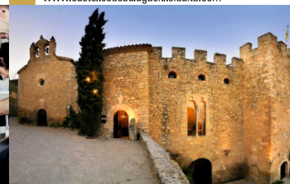
10 Castell de Montsonís Tel. 973 402 045 · MONTSONÍS www.castellsdeleida.com