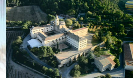
1 Monestir de les Avellanes Tel. 973 438 006 · OS DE BALAGUER www.monestirdesavellanes.com

El Montsec és un indret on la natura es confon amb la història i on cada moment històric ha deixat la seva empremta. Resseguir el traç d'aquells que antigament habitaren aquestes contrades és part del viatge de la memòria que es pot viure al Montsec.