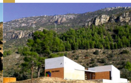
14 Espai Orígens Tel. 973 420 068 · CAMARASA www.espaiorigens.es