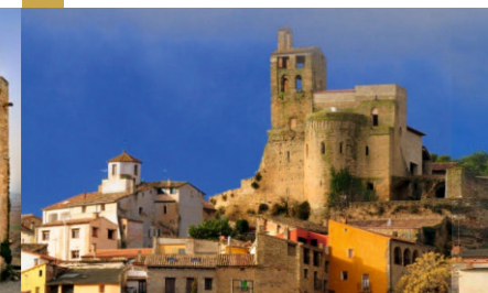
11 Col·legiata de Sant Pere d'Àger Tel. 973 455 004 · ÀGER www.ager.cat