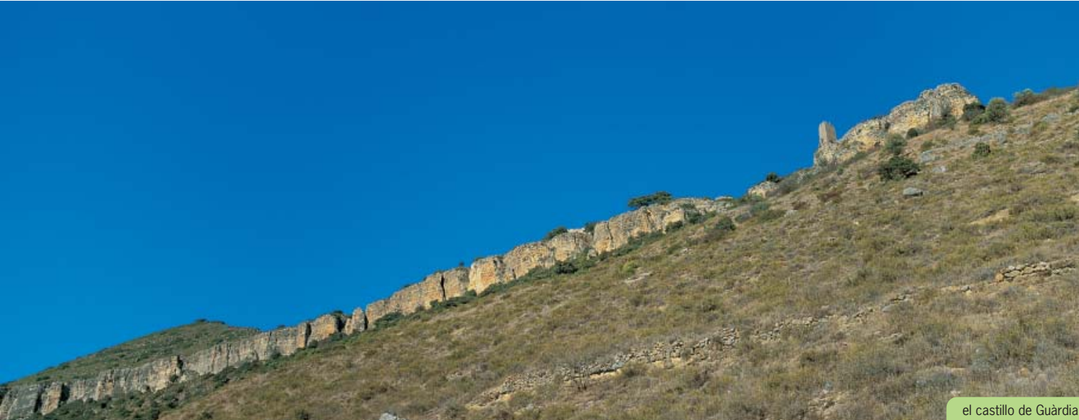
el castillo de Guàrdia