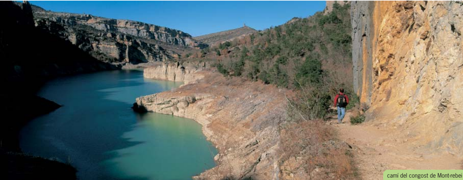
camí del congost de Mont-rebei