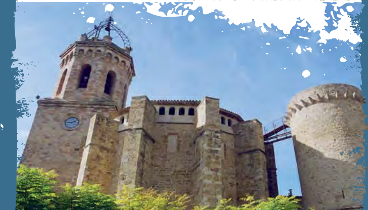
Basilica de la Mare de Déu de Valldelfors