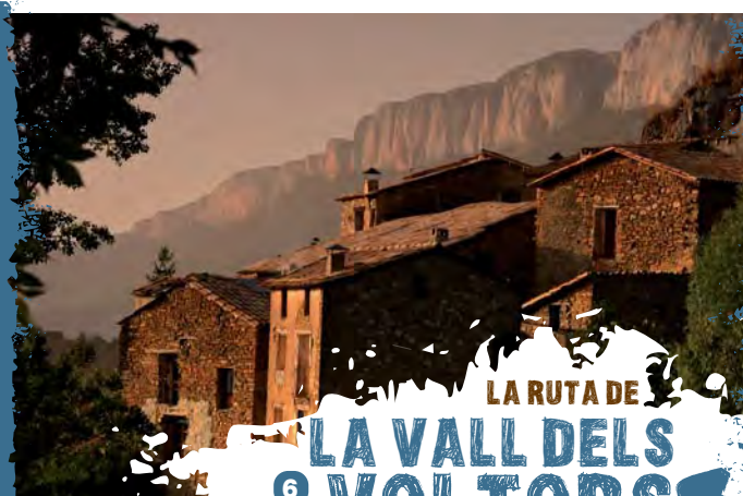
Espluga de Serra

Al costat més occidental del Pallars Jussà, a la zona coneguda com la Terreta (municipi de Tremp), sorgeix una gran depressió prepirinenca entre la serra de Sant Gervàs i la serra de Castellet de gran valor natural i cultural. Hi trobem LA RUTA DE LA VALL DELS VOLTORS , de gran interès pels seus paisatges; per la fauna, amb espècies com: el voltor, el trencales, l'aufrany, el gat fer, la geneta i el ratpenat; i per la flora: la roureda d'Aulàs i la fageda de Castellet.