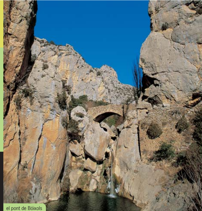
el pont de Bóixols

Com a bona part del Pallars Jussà, al cel de Bóixols no és difícil veure volar a grans alçades el vultur, sol o en grans estols, sempre fitant el terra a la recerca d'algun animal mort. La llarga tradició de la ramaderia extensiva d'ovelles d'aquestes terres ha fet que històricament hi trobés sovint menjar, tot i que actualment comença a escassejar. A més, les parets de la serra de Carreu orientades a sud són un excel·lent indret perquè el vultur hi faci el niu. Amb molta més sort i paciència també és possible veure el trençalòs, una de les espècies protegides dels Pirineus, i en època de bon temps, l'aufany. Pel que fa a la vegetació es tracta d'una zona d'alzinars i rouredes amb la presència de pinars de pi roig en les obagues. El boix, la savina i la boixerola predominen al sotabosc, tot i que el més conegut de la zona és la presència de bolets a la tardor.